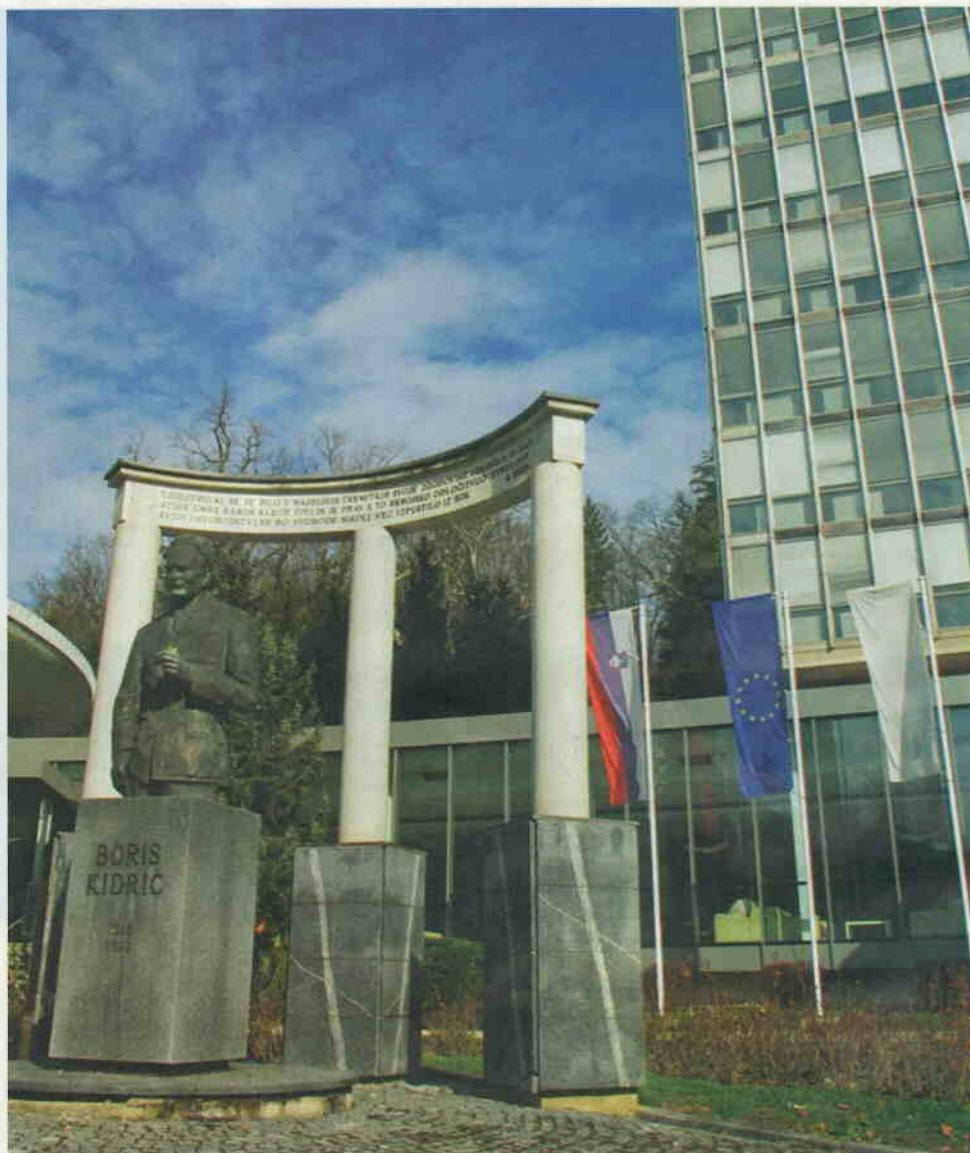
Kidričev spomenik v Rogaske Slatine

Komunisti so od 5. do 8. julija 1942 na Cinku v Kočevskem rogu organizirali partijsko konferenco, na katero so povabili svoje aktiviste s širšega območja Ljubljanske pokrajine. Osrednji referat je v odsotnosti Kardelja imel Boris Kidrič. Na dolgo je v takratni značilno zmaličeni, vendar slovesni govorici nanizal »velike uspehe« OF, narodnoosvobodilne vojske, komunistične partije, ki so jih dosegli skupaj z veliko bratsko Stalinovo Sovjetsko zvezo. Velik del referata je posvetil »beli gardi«, zaradi katere je treba »izvajati množično pojasnjevalno kampanjo, zato da prepereš tolpi, ki se je izrodila v vulgarno sovražnikovo agenturo, da bi se znova posluževala političnih argumentov. Brezobzirno uničevati tolpo, trebiti jo na slehernem koraku, ker je pač izdajalska tolpa in ker se nahajamo v vojnem času – taki sta dve osnovni nalogi našega današnjega boja proti beli gardi, zlasti na osvobojenem ozemlju. /.../ Če bomo mi vse te ljudi, ki so pošteni, pa ne morejo tako hitro slediti, strpali v tabor bele garde, bi lahko imeli več sovražnikov nego prijateljev, ustvarili bi beli gardi množice. Nadalje je treba udariti po mišljenju, da je dovolj belo gardo fizično trebiti in da danes ni več potrebno slovenskim ljudskim množicam pojasnjevati, kaj je bela garda in zakaj jo je treba uničevati. Ni dovolj, da belo gardo fizično trebimo, treba jo je hkrati politično razkrinkavati.« Z drugimi besedami je to pomenilo, da ni bilo dovolj ljudi pobijati, treba jih je