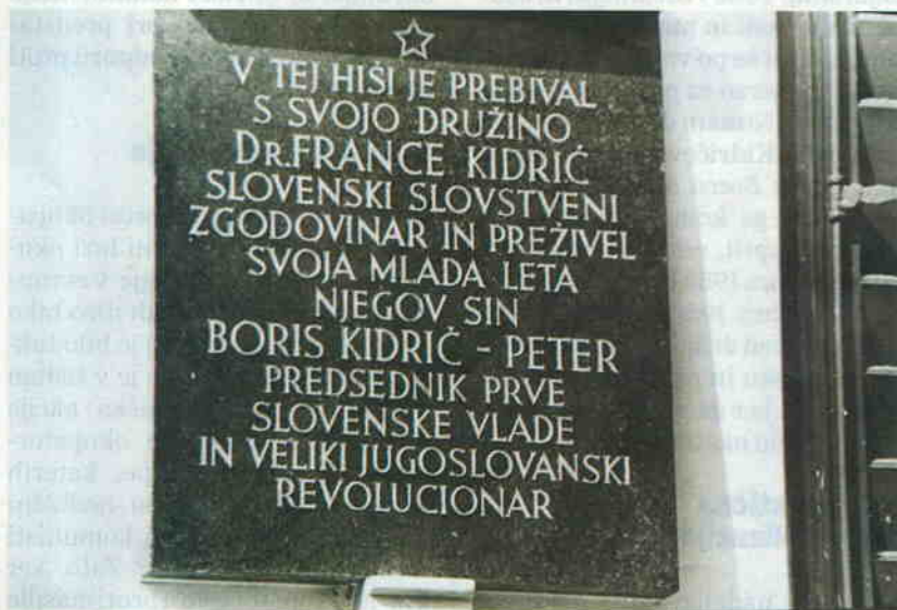
Spominska plošča na hiši v Ljubljani, kjer je živel

Leta 1944 je Boris Kidrič poslal v Moskvo daljše poročilo Kratek obris razvoja OF in sedanja politična situacija v Sloveniji , v katerem je med drugim za začetno obdobje je med drugim za začetno obdobje 1941–1942 ugotovil: »Moralno političnemu pritisku vsenarodne