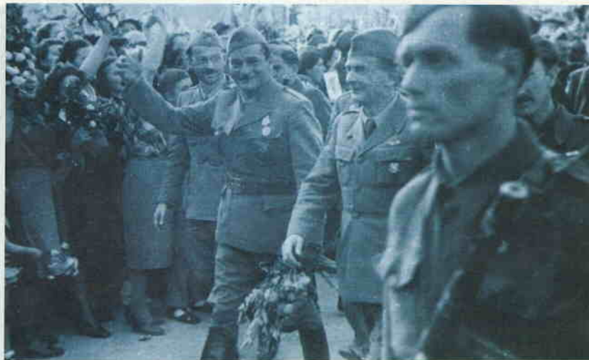
Slavljenje Borisa Kidriča takoj po koncu vojne morije v Ljubljani