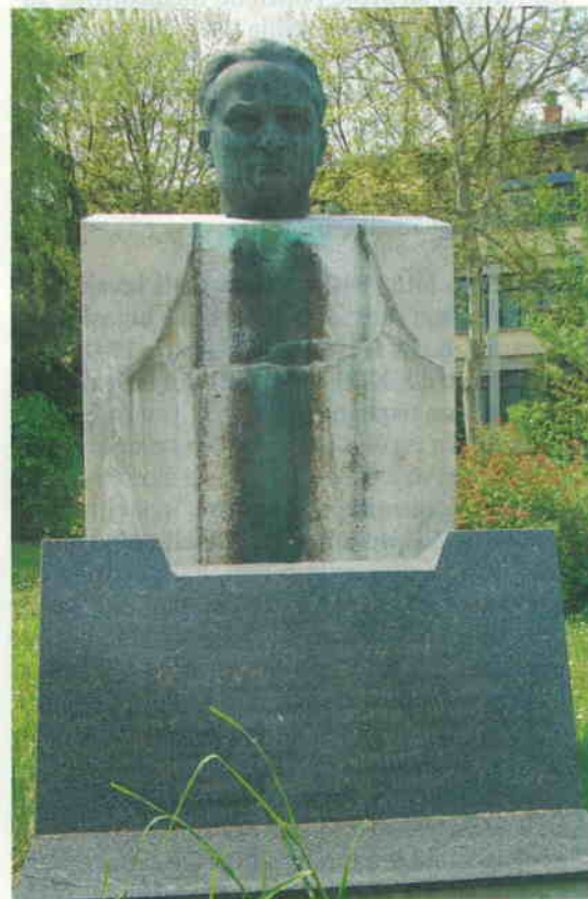
Kidričev spomenik v Šentvidu pri Ljubljani

28. julija 1941 je na seji, sklicani na pobudo CK KPS, Vrhovni plenum OF določil norme za »kaznovanje izdajalcev« in za »kazenski postopek« proti njim. Začela se je nepretrgan komunistični politični boj proti tradicionalnim strankam in vodilnim posameznikom v obliki blatilne gonje. 9. avgusta 1941 je Slovenski poročevalec objavil članek Borisa Kidriča Polet osvobodilne fronte , v katerem je zapisal: »Kdor danes ostaja še izven Osvobodilne fronte, ta je suha veja na živem narodovem telesu. Kdor pa kakor koli deluje proti Osvobodilni fronti in njeni enotnosti – ta je samega sebe izločil iz narodne skupnosti in bo nekoč še polagal račun pred narodom!« Šlo je torej za ponavljanje monopolizacije in povsem jasne grožnje.